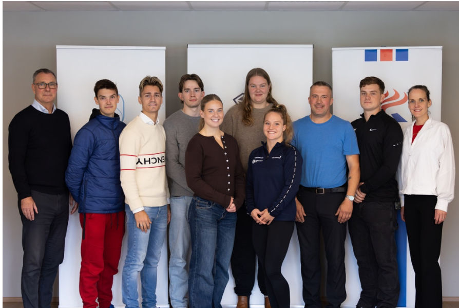
Styrkþegar Ólympíusamhjálpinnar vegna Los Angeles 2028